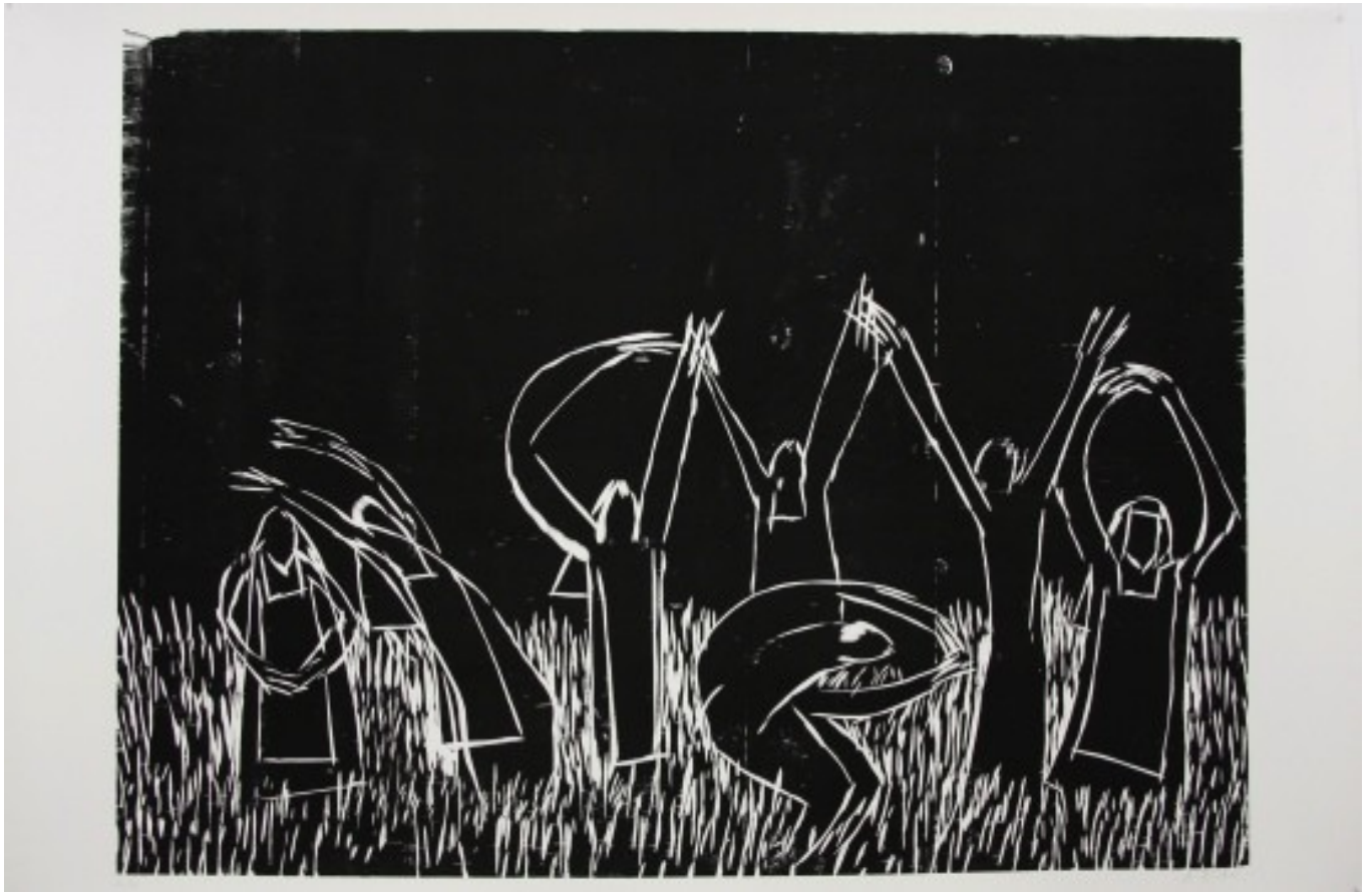
Dancing Nuns 2007 stampa xilografica 120x180 cm