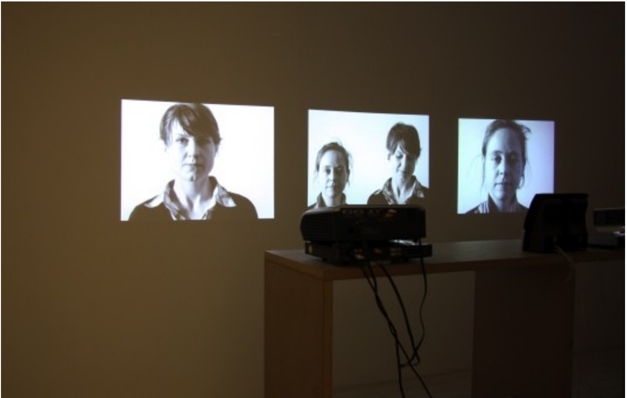
I feel shame / We feel shame / I feel shame 2008 film in 16 mm trasferito su DVD, 2:40 min. app.