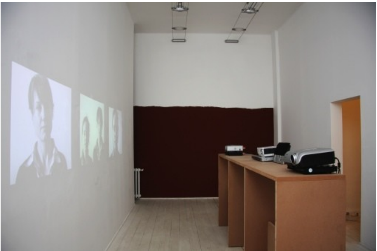
I feel shame / We feel shame / I feel shame 2008 film in 16 mm trasferito su DVD, 2:40 min. app.